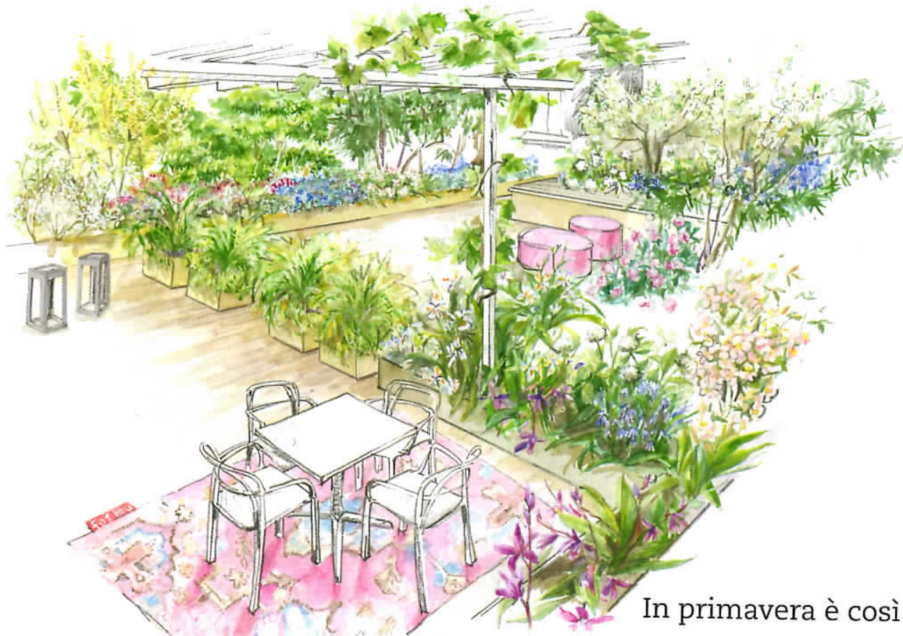
In primavera è così

Il pouf. Disegnato da Marco Dondoli e Claudio Pucci, Wow 480, di Pedrali regala un tocco ironico al terrazzo. In polietilene colorato, materiale sintetico adatto all'esterno, è disponibile in diverse sgargianti tonalità. Alto 45 cm, ha un diametro di 40 e costa 98 €.