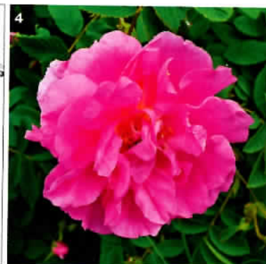
1. Il giardino nato all'interno del carcere di Bergamo. 2. Uno scorcio della tenuta presidenziale di Castelporziano (Roma). 3. La mappa del parco del Castello di Cordovado (Pordenone): a destra, a forma di sole, il nuovo labirinto di rose damascene (nella foto 4 un primo piano).