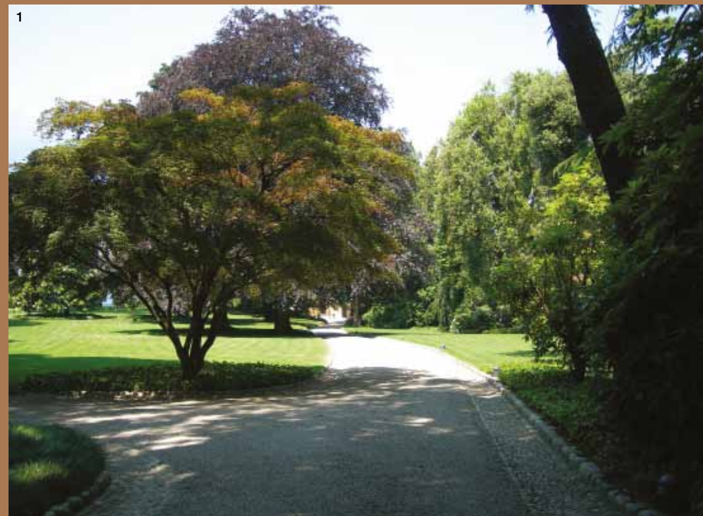
1. VUE SUR L'ALLÉE PRINCIPALE QUI MÈNE À LA VILLA.

EN PRENANT UN AUTRE CHEMIN LATÉRAL, DE PETITS SENTIERS PERMETTENT DE REJOINDRE L'ALLÉE PRINCIPALE.